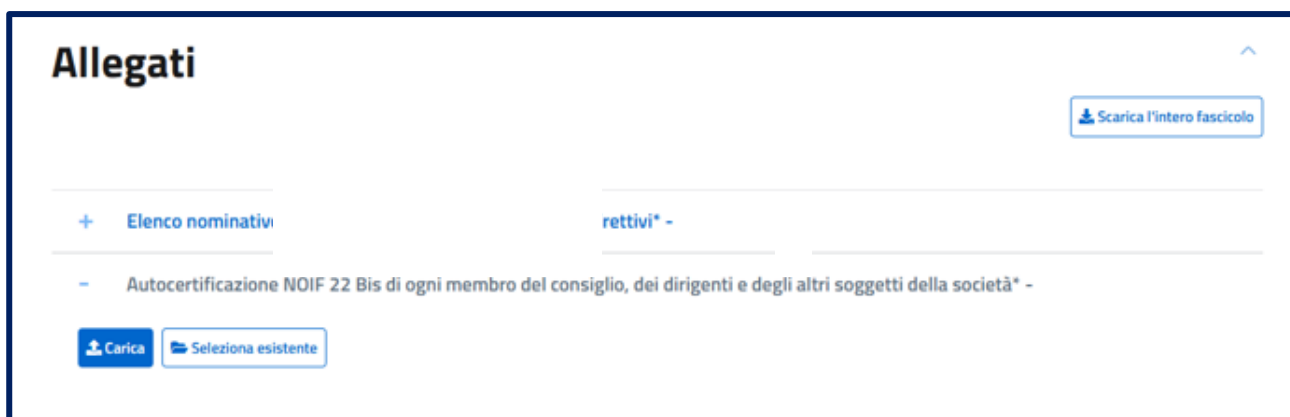
Figura 13 - Modalità di caricamento file scansionato nella sezione Allegati (passaggio 2)

Per effettuare l'upload del documento si potrà trascinare direttamente il file oppure cliccare su Seleziona dal dispositivo , procedere con la selezione del documento da caricare e infine cliccare su APRI (figura 14)